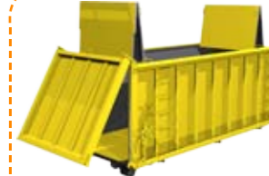
Thùng chở rác Garbage carrying container

SỰ LỰA CHỌN CỦA CÁC NHÀ ĐẦU TƯ TIÊN PHONG