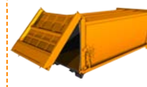
Thùng chở rác Garbage carrying container