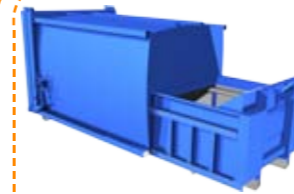
Thùng ép và chở rác Garbage compacting container