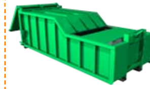
Thùng chở bùn Mud carrying container