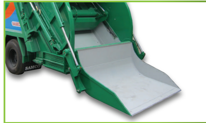
Máng ủi và nạp rác Bulldozing garbage