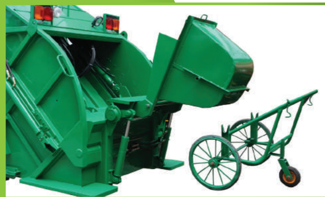
Cặp thùng tiêu chuẩn loại đẩy hai tay Two-arms garbage loading structure