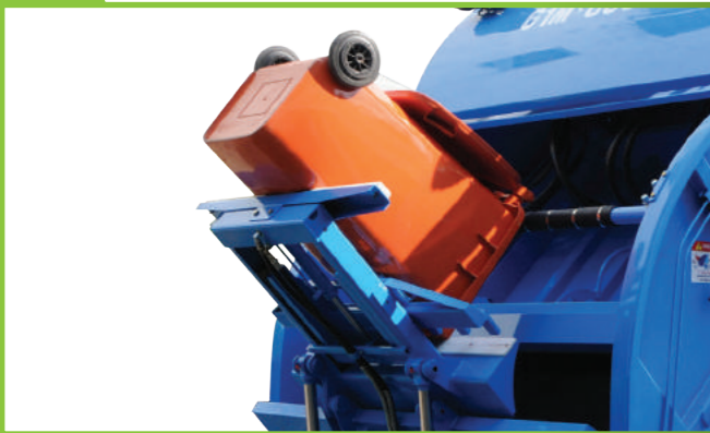
Cặp thùng tiêu chuẩn 240L/660L Standard 240L/660L garbage bin