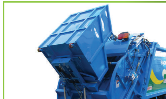
Cặp thùng rác tiêu chuẩn kết hợp với máng nạp rác có thể tháo rời. Standard garbage loading structure combined with removable garbage bulldoze