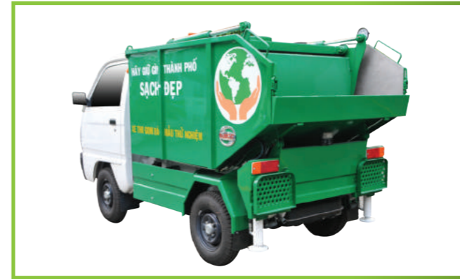
Xe ép rác SUZUKI CARRY TRUCK - 2m 3 SUZUKI CARRY TRUCK garbage truck 2m 3