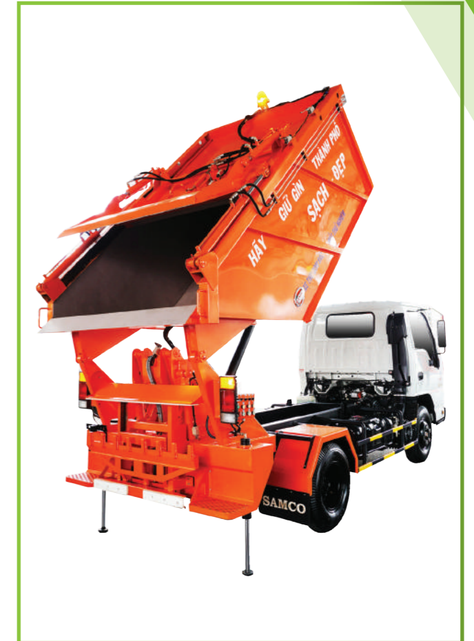
Xe ép rác ISUZU QKR77FE4 - 4,5m 3 ISUZU garbage truck 4,5m 3