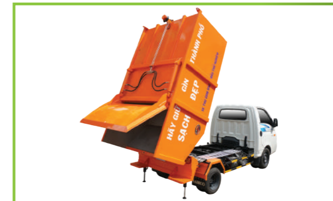
Xe ép rác HYUNDAI NEW PORTER 150 - 3m 3 HYUNDAI NEW PORTER garbage truck 3m 3